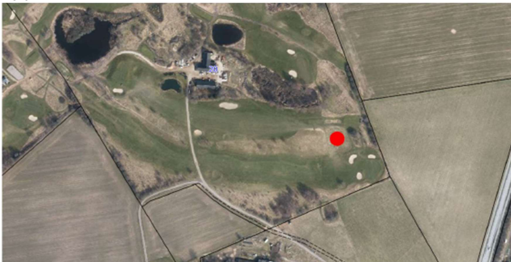
Den planlagte sø set i en større sammenhæng